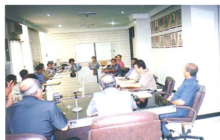
Audiensi Koalisi Masyarakat Sipil Untuk Kasus Abepura di Kejagung 11 September 2002: Kontrol independensi Lembaga Yudikatif, Dok. PBHI, 2002

Menurut UU Pengadilan HAM No. 26/2000, setelah mengalami perpanjangan waktu, Kejaksaan Agung harus sudah menyerahkan berkas perkara itu ke pengadilan. Tapi hingga batas waktu tersebut, Kejaksaan tidak juga menyelesaikan tugas penyidikannya. Strategi buying time dalam penanganan kasus ini nampak sekali dengan dihabiskannya semua peluang dalam UU 26/2000 tentang perpanjangan waktu penyidikan. Di samping itu juga muncul berbagai alasan teknis yang tidak substansi tentang sulitnya menembus birokrasi kepolisian, anggaran penyidikan, dan lain sebagainya, yang membuat proses penyidikan itu terhambat.