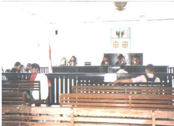
Pengadilan Negeri Makassar(Pengadilan HAM Abepura).